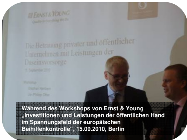
Während des Workshops von Ernst & Young „Investitionen und Leistungen der öffentlichen Hand im Spannungsfeld der europäischen Beihilfenkontrolle“, 15.09.2010, Berlin