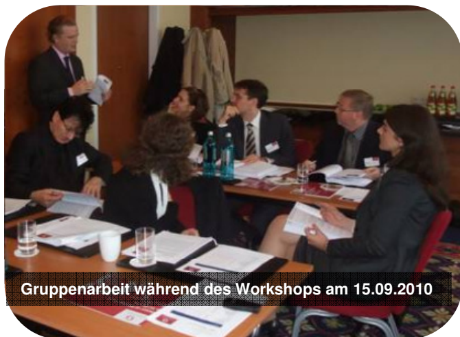
Gruppenarbeit während des Workshops am 15.09.2010