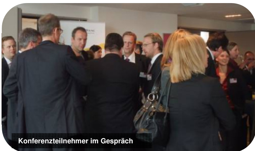
Konferenzteilnehmer im Gespräch