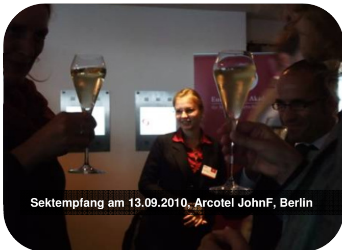
Sektempfang am 13.09.2010, Arcotel JohnF, Berlin